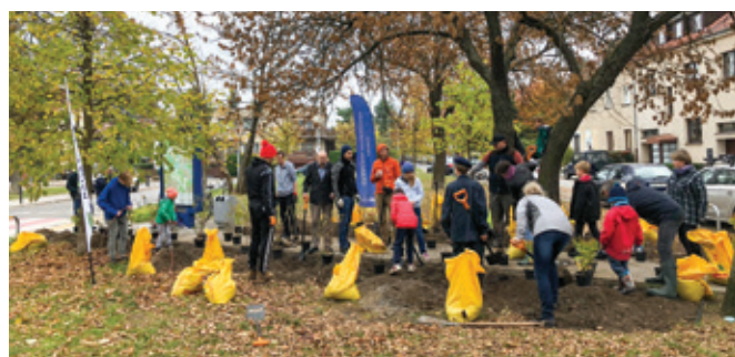
Sąsiedzkie nasadzenia przy Blacharskiej