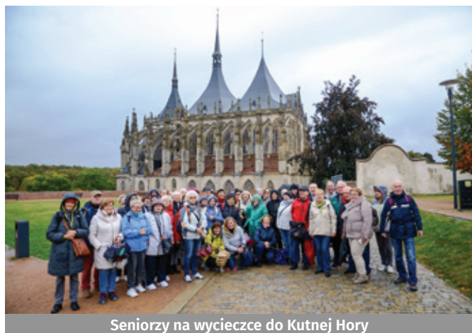
Seniorzy na wycieczce do Kutnej Hory