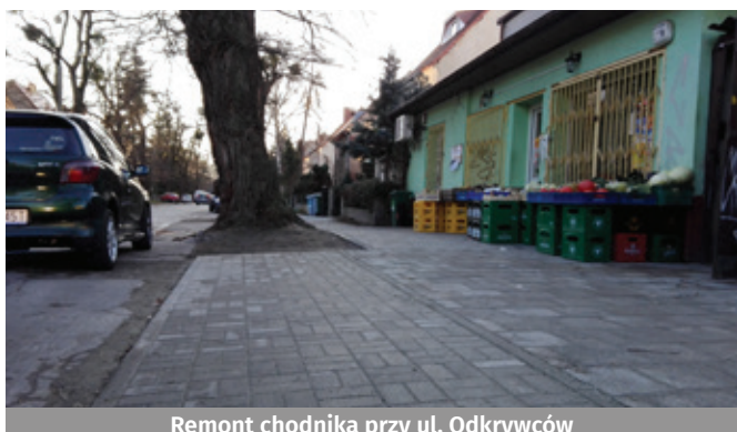
Remont chodnika przy ul. Odkrywców