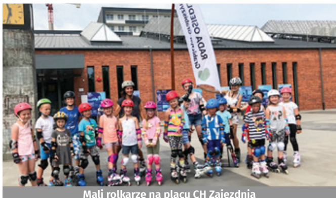
Mali rolkarze na placu CH Zajezdnia