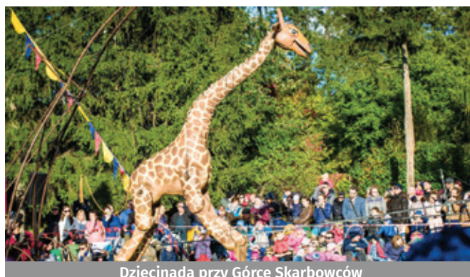
Diecಿನada przy Górcie Skarbowców

Przewodnicząca Zarządu Osiedla Grabiszyn-Grabiszynek