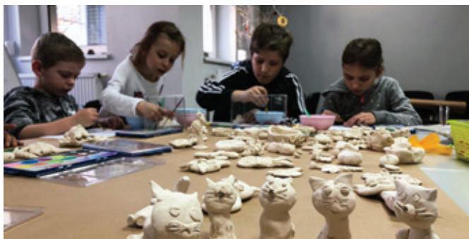
Ceramiczne warsztaty w siedzibie Rady Osiedla