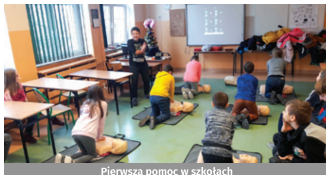
Pierwsza pomoc w szkołach