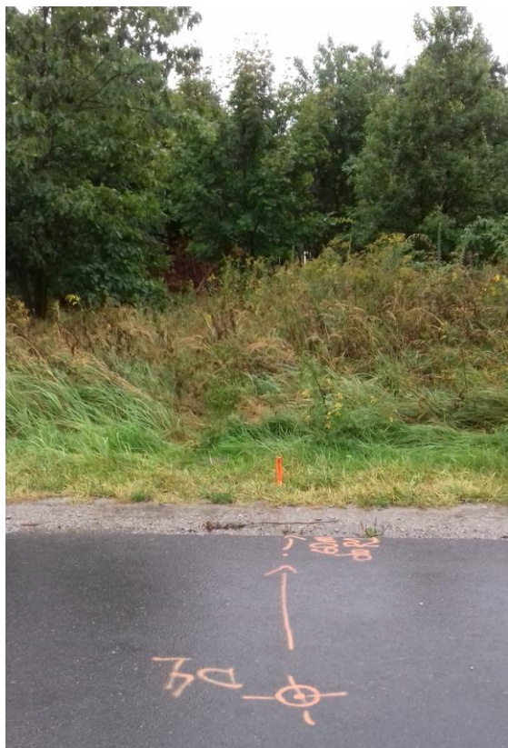
Fot. Działka 3/7 AR_5 obręb Lipa Piotrowska miejsce wytyczone pod budowę nowego rowu mającego pełnić funkcję odwodnienia ul. Cynamonowej – stan na 1.09.2017