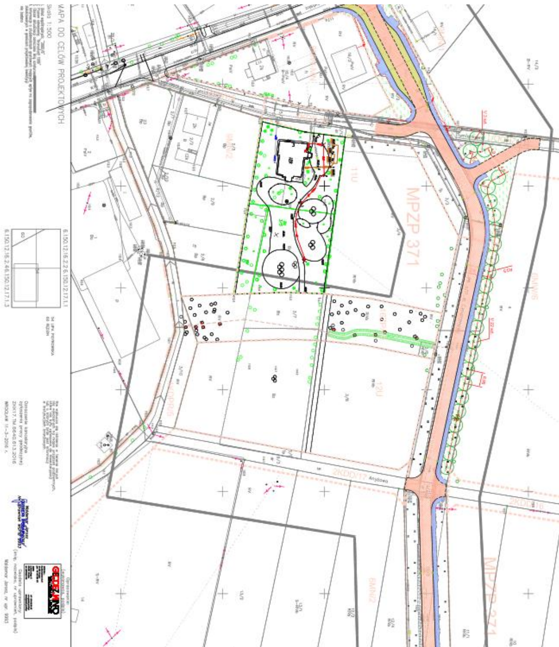
Mapa 1. Projekt przebudowy ulicy Cynamonowej