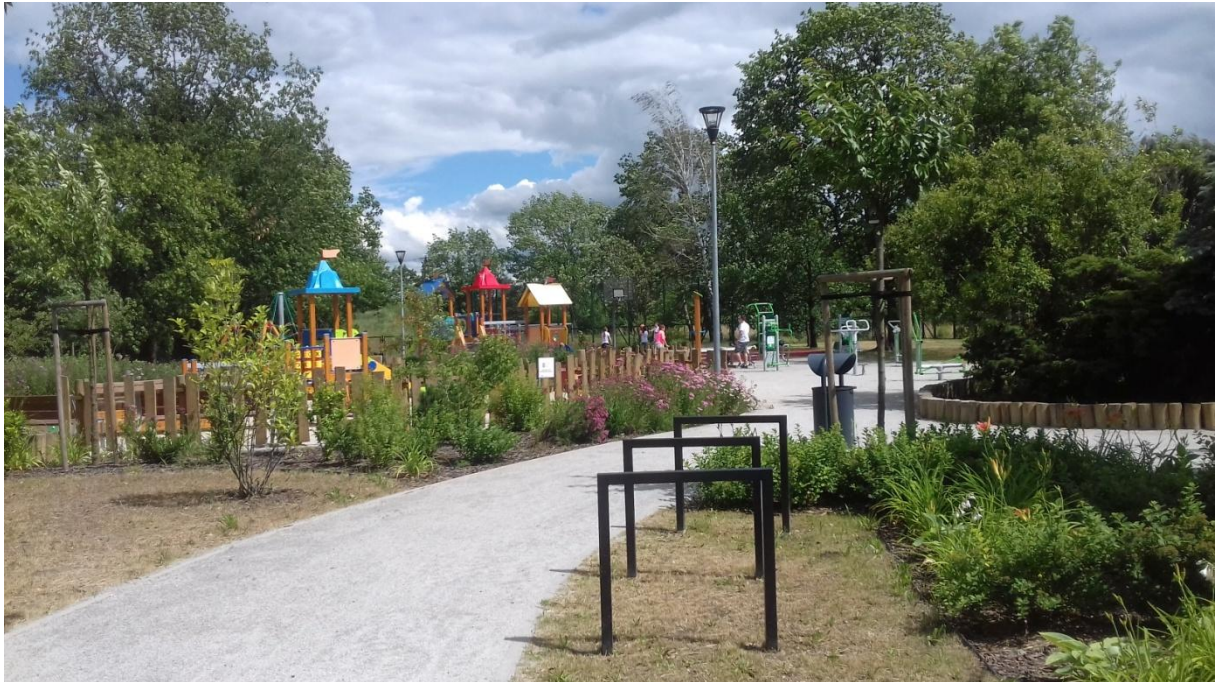
Fot. 9. Uschnięte topole za górką i brzoza na pierwszym planie na terenie zrewitalizowanym w ramach projektu nr 41 WBO 2015